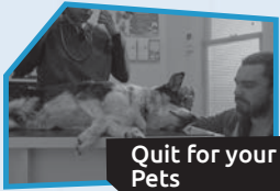
Annnonce n° 1