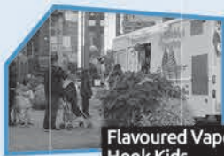
Annonce n° 8