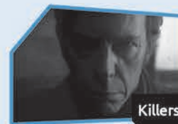
Annnonce n° 5