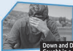
Annonce n° 10