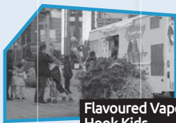
Annonce n° 8