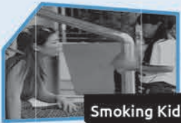
Annnonce n° 2