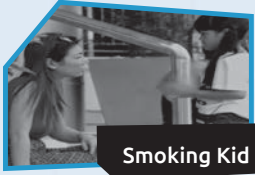
Annnonce n° 2