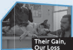
Annnonce n° 1