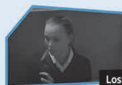
Annonce n° 11