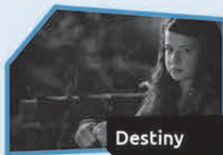
Annnonce n° 3