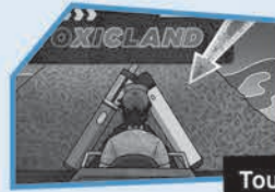
Annonce n° 12