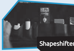
Annnonce n° 4