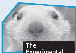
Annonce n° 9