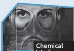
Annonce n° 7