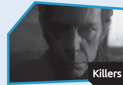
Annnonce n° 5