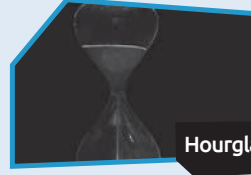
Annnonce n° 6