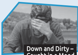
Annonce n° 10