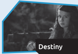
Annnonce n° 3