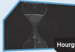
Annnonce n° 6