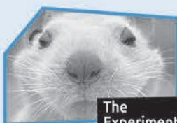
Annonce n° 9