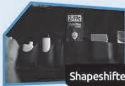
Annnonce n° 4