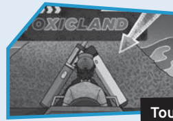
Annonce n° 12