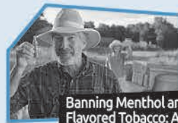
Annonce n° 12

Banning Menthol and Flavored Tobacco: A major way to protect youth