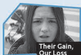
Annnonce n° 1