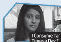
Annnonce n° 5