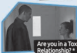
Annnonce n° 4