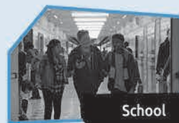
Annonce n° 10