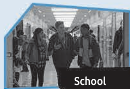
Annonce n° 10