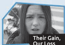
Annnonce n° 1