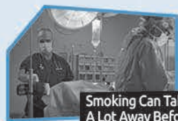
Annnonce n° 2