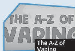
Annonce n° 9