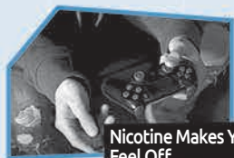
Annonce n° 8