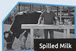
Annonce n° 7