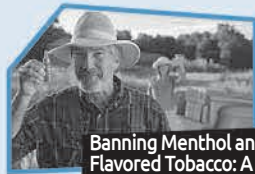
Annonce n° 12

Banning Menthol and Flavored Tobacco: A major way to protect youth