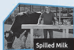
Annonce n° 7