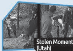
Annnonce n° 6

Selon MOI , l'annonce qui a fait le meilleur travail pour me convaincre de ne pas commencer à fumer ou d'arrêter de fumer est :