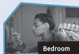
Annonce n° 11