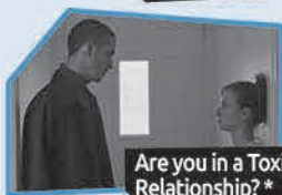
Annnonce n° 4