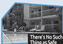
Annnonce n° 3