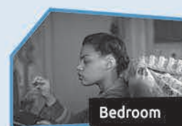
Annonce n° 11