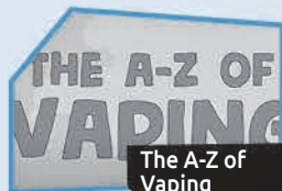
Annonce n° 9