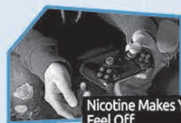
Annonce n° 8