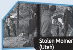
Annnonce n° 6

Selon MOI , l'annonce qui a fait le meilleur travail pour me convaincre de ne pas commencer à fumer ou d'arrêter de fumer est :