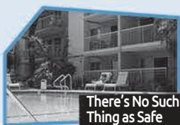
Annnonce n° 3