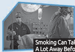
Annnonce n° 2