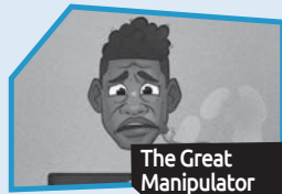
Annonce n° 7