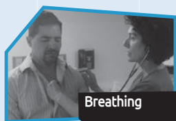
Annnonce n° 1