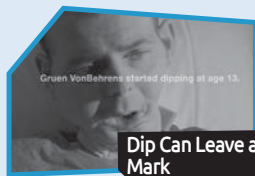
Annnonce n° 5

Selon MOI , l'annonce qui a fait le meilleur travail pour me convaincre de ne pas commencer à fumer ou d'arrêter de fumer est :