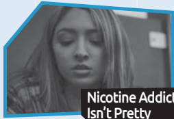
Annonce n° 7