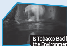
Annnonce n° 2