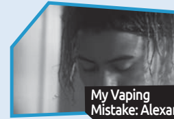
Annonce n° 8