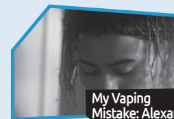
Annonce n° 8