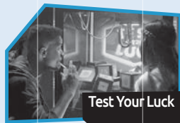
Annonce n° 9