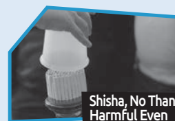
Annnonce n° 3