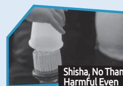
Annnonce n° 3