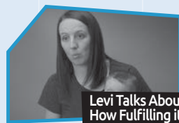
Annnonce n° 4