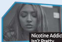
Annonce n° 7