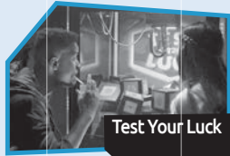
Annonce n° 9