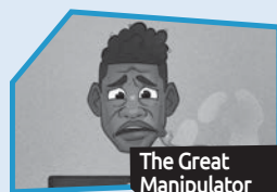
Annonce n° 7