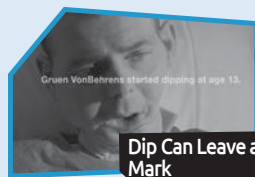
Annnonce n° 5

Selon MOI , l'annonce qui a fait le meilleur travail pour me convaincre de ne pas commencer à fumer ou d'arrêter de fumer est :