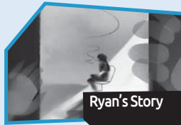
Annonce n° 10