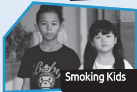
Annance n° 2