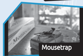
Annance n° 10