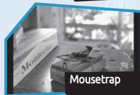
Annance n° 10