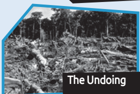
Annance n° 6