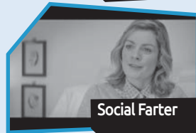
Annance n° 11