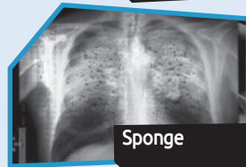
Annance n° 12