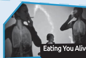
Annance n° 9