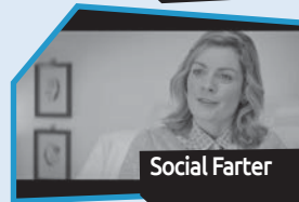
Annance n° 11