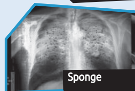
Annance n° 12