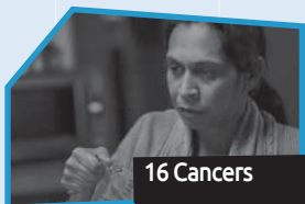
Annance n° 1

à ne pas commencer à fumer ou à arrêter de fumer? Prends quelques notes pendant que tu visionnes les annonces pour t'aider à te les remémorer plus tard au besoin.