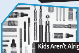
Annance n° 8