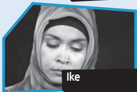
Annance n° 7