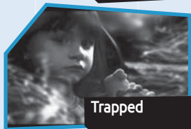
Annance n° 3