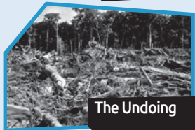
Annance n° 6