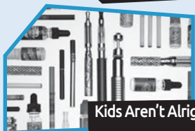
Annance n° 8