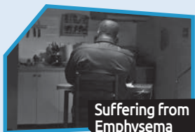
Annance n° 5