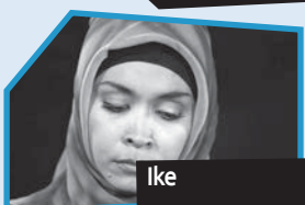
Annance n° 7