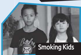
Annance n° 2