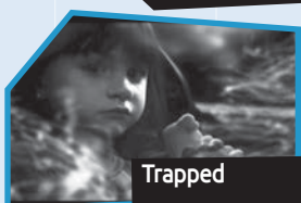
Annance n° 3