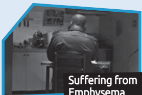
Annance n° 5