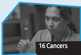
Annance n° 1

à ne pas commencer à fumer ou à arrêter de fumer? Prends quelques notes pendant que tu visionnes les annonces pour t'aider à te les remémorer plus tard au besoin.