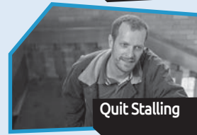
Announce n° 11