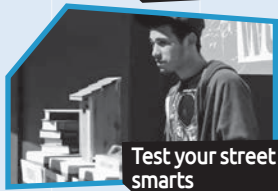
Announce n° 2