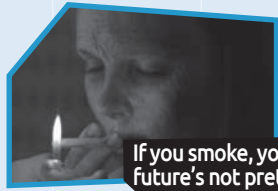
Announce n° 1

Quelle annonce a fait le meilleur travail pour t'aider à ne pas commencer à fumer ou à arrêter de fumer? Prends quelques notes pendant que tu visionnes les annonces pour t'aider à te les remémorer plus tard au besoin.