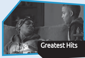
Announce n° 3