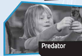
Announce n° 10