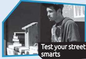
Announce n° 2