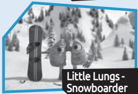
Announce n° 7