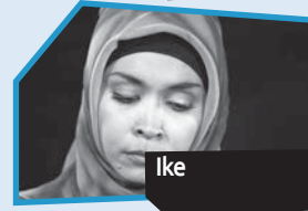
Announce n° 12