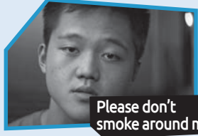
Announce n° 8