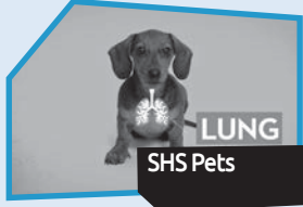
Announce n° 6