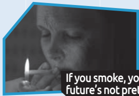
Announce n° 1

Quelle annonce a fait le meilleur travail pour t'aider à ne pas commencer à fumer ou à arrêter de fumer? Prends quelques notes pendant que tu visionnes les annonces pour t'aider à te les remémorer plus tard au besoin.