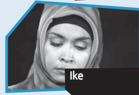
Announce n° 12