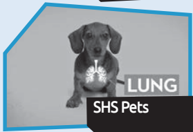
Announce n° 6