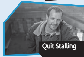
Announce n° 11