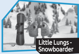
Announce n° 7