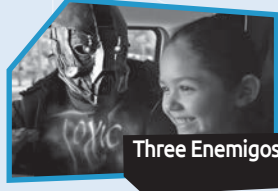
Announce n° 4