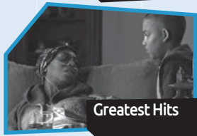
Announce n° 3