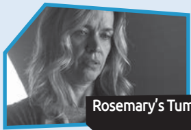
Announce n° 5