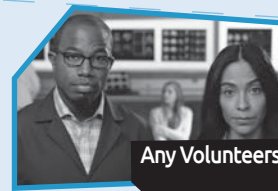
Announce n° 9