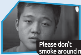
Announce n° 8